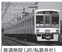
鉄道施設 (JR/私鉄各社)